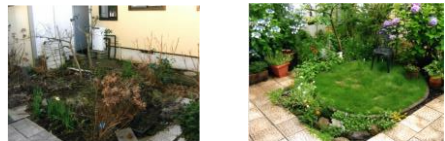
手入れ後、きれいな花が咲きました。

庭の管理に負担を感じることはありませんか。エコロ生活支援を請け負って4年がたちますが、回転木馬で、一番多く依頼があるのはガーデニング（草取り、枝切り）です。長年利用してくださる方の中には、特定のスタッフを指名されるかたもいます。夏は、暑い時間帯を避けて、夕方から作業します。草取りをした後は見違えるようにきれいになり喜ばれています。生活クラブのお片付け事業（遺品整理、生前整理、部屋のお片付け）も承っています。