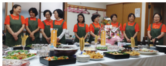
創立10周年記念のお祝いは手作りピュッフェでおもてなし W.Co菜の花

千葉のワーカーズ・コレクティブは様々な業種で事業を展開しています。2016年度の<わくわく>では、業態を大きく三つに分けて特集していきます。今回107号では、千葉を代表する部門といっても過言ではない業態「食部会」を紹介します。