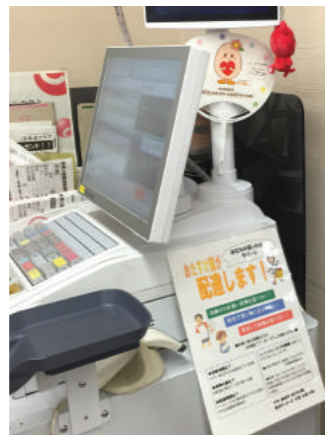
「配達します」のチラシをレジに張っています

*おたすけ隊:生活クラブ虹の街のエッコロ共済として組合員への生活支援を担う有償グループ